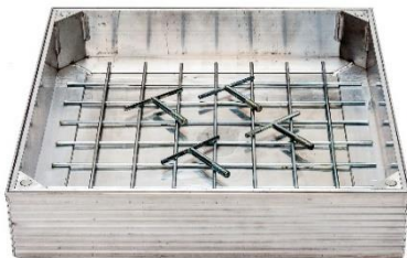
Type DC Pro-line